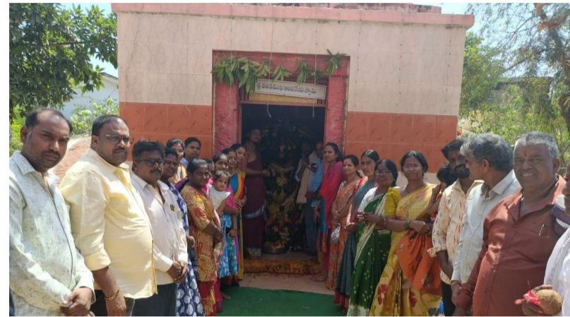
సంత బజారులోని హనుమాన్ దేవాలయం....