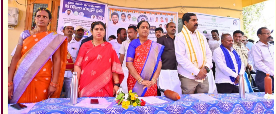
● 99 రోజుల కార్యచరణతో సమగ్ర గ్రామాభివృద్ధి ఎమ్మెల్యే