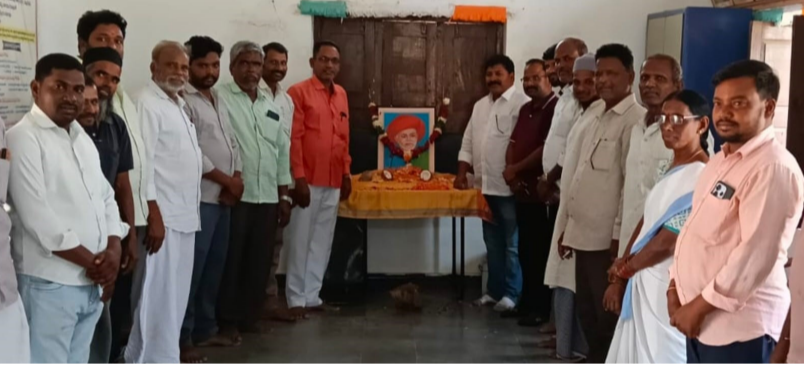
వాడియాల గ్రామపంచాయతీ కార్యాలయంలో