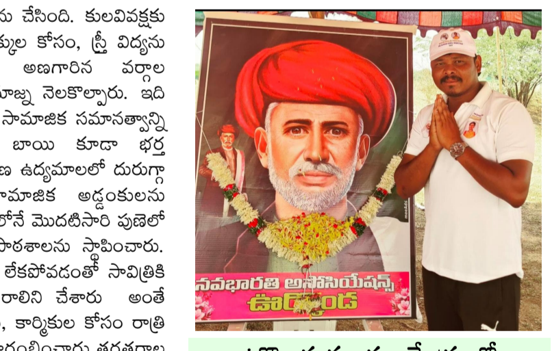
ఉర్కొండ మండల కేంద్రంలో

పుస్తక ‘సార్వజనిక సత్య ధర్మను పట్టుదలతో పూర్తిచేసి 63 ఏళ్లకే తుదిశ్వాస విడిచారు. వారి స్ఫూర్తితో నేడు దేశంలో సామాజిక వివక్ష గురవుతున్న పేదల జీవితాలలో వెలుగు నింపడానికి కృషి చేస్తుందని అన్నారు. ఈ కార్యక్రమంలో వివిధ పార్టీల రాజకీయ నాయకులు, అంబేద్కర్ సంఘం నాయకులు, కమిటీ సభ్యులు తదితరులు పాల్గొన్నారు.