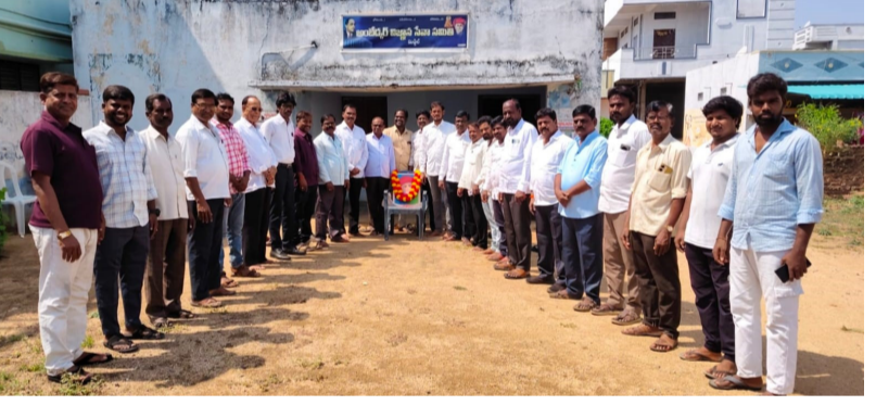
మిడ్చిల్ మండల కేంద్రంలో అంబేద్కర్ భవన్ ఆవరణలో