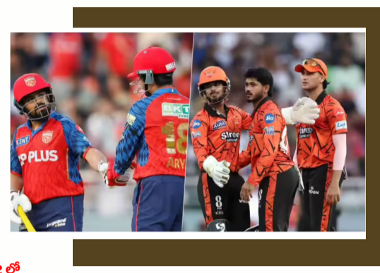
-మగతా 2 లో