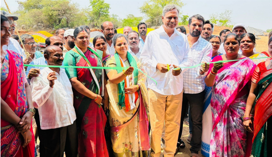
ఉమ్మడి వరంగల్, ఏప్రిల్ 13 (నేటి దర్శిని బ్యూరో): ఉమ్మడి వరంగల్ జిల్లాజనగామ నియోజకవర్గం బచ్చనపేట మండలంలోని చిన్న రాంచర్ల,